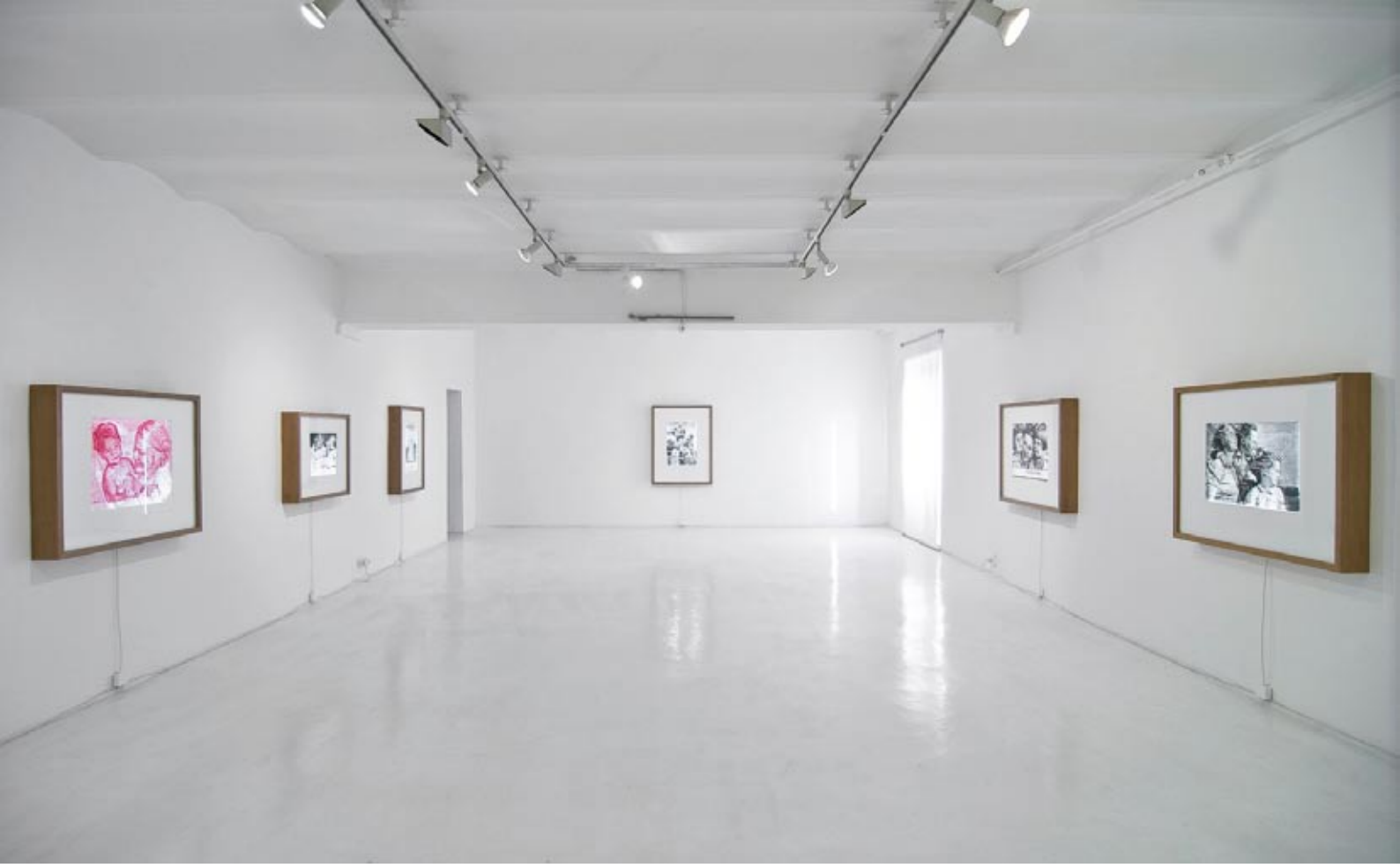
"Archiv , Mutter und Kind", 2011. Installation view at Studio d'Arte Contemporanea Pino Casagrande, Rome