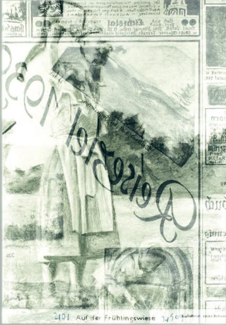
"Archiv 210/ Mutter und Kind, Nr.1" Charcoal and pastel drawing on paper in light box. 150 x 100 cm, 2011