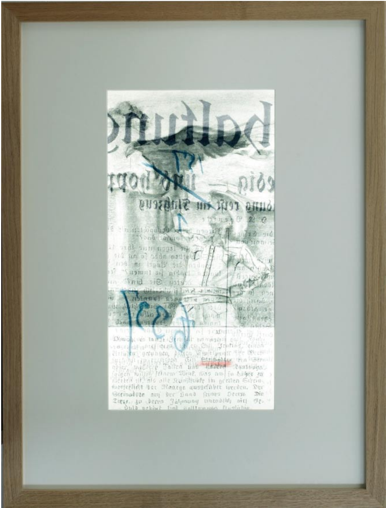
"Archiv 157/1, Adler Nr. 4" Charcoal and pastel drawing on paper in light box . 100 x 75 cm, 2012