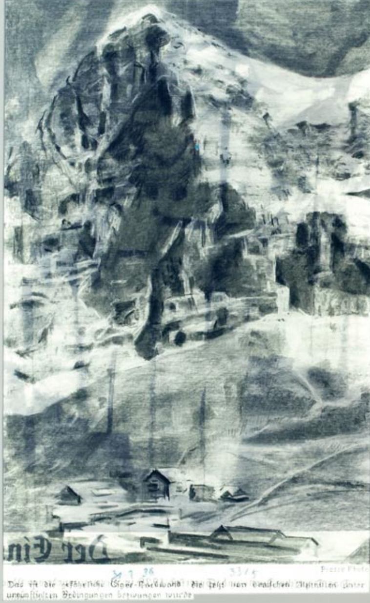
"Archiv 33/5, Eiger-Nordwand Nr.1" Charcoal and pastel drawing on paper in light box. 150 x 105 cm, 2012