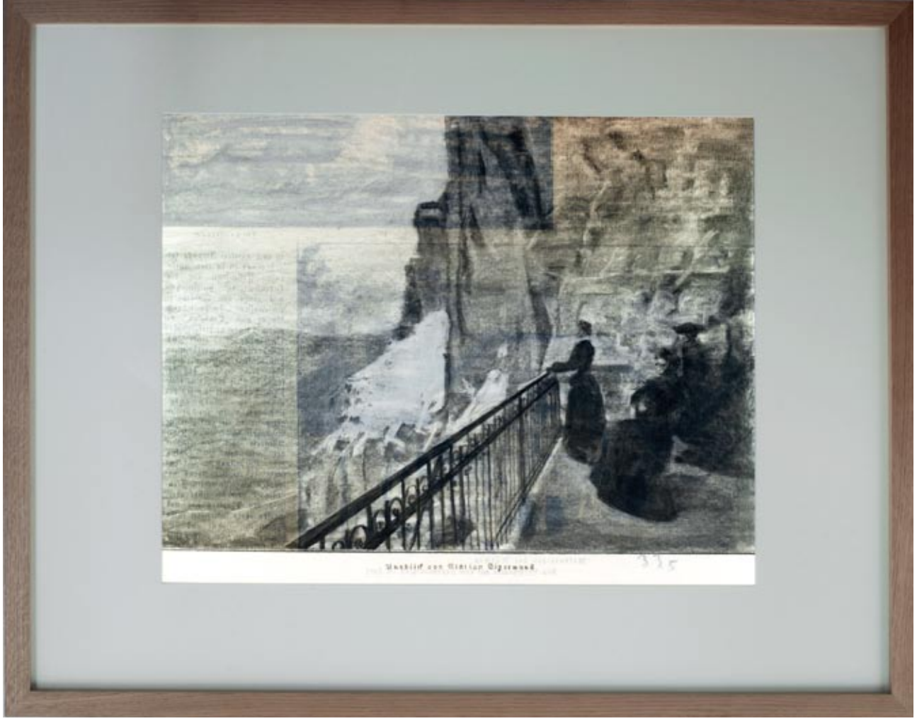
“Archiv 33/5, Eiger-Nordwand Nr.4” Charcoal and pastel drawing on paper in light box. 105 x 135 cm, 2012