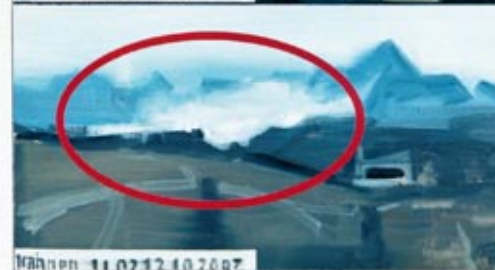
Der Felssturz am Einser, aufgenommen von einer Webcam.

ten ist schwierig. Man muss sehr genau wissen, wie sich welches Gestein unter