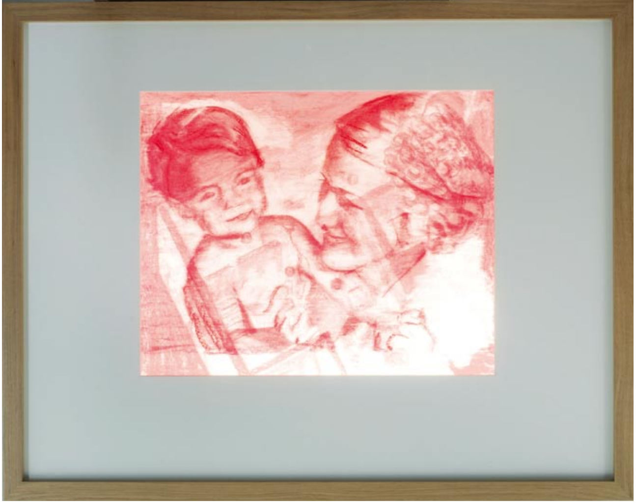
"Archiv 210/ Mutter und Kind, Nr.5" Charcoal and pastel drawing on paper in light box. 95 x 120 cm, 2011