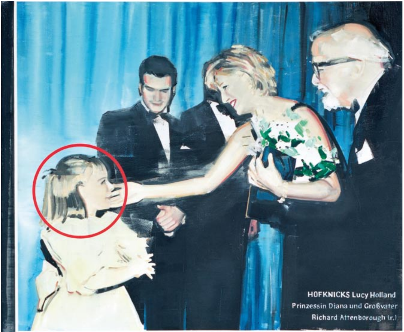
Bilder mit "Hofknicks" 135 x 153,5 cm, 2008